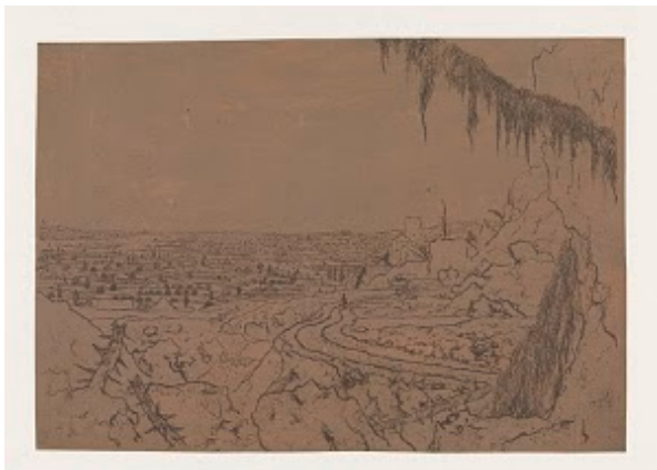
1 ste staat van de etsplaat

Hercules Segers (1589/90-c.1640) was een van de meest eigenzinnige 17de-eeuwse kunstenaars. Hij schilderde en etste vooral bergachtige fantasielandschappen. Segers is beroemd geworden om zijn 'gedrukte schilderijen': beschilderde prenten of bedrukte doeken. Van zijn schilderijen is weinig meer over, in totaal 11 werken. Er bestaan nog 183 afdrukken van 54 etsen, die Segers allemaal verschillend heeft bewerkt. Hercules werd Haarlem geboren, in een Vlaams immigrantengezin. Hij ging in Amsterdam in de leer bij de Vlaamse schilder Gillis van Coninxloo en zijn werk past in de Vlaamse landschapstraditie. Al in de 17de eeuw was Segers' werk zeer populair. Het beïnvloedde onder andere Rembrandt, die zelf acht werken van Segers bezat. Ook de stadhouder, Frederik Hendrik, en de Deense koning hadden werk van hem in hun collectie. Segers woonde in Haarlem, Leiden, Amsterdam, Utrecht en Den Haag, waar hij gestorven is.