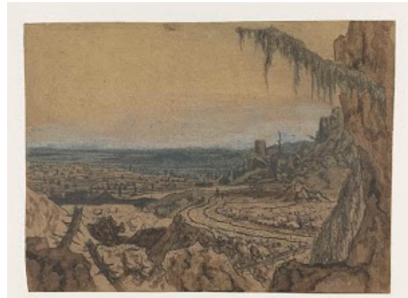
laatste staat van de etsplaat en ingekleurd

Hieronder naar de link Hercules Segers An Introduction